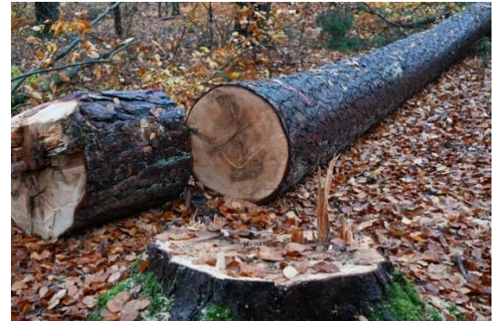
Wird künftig ab dem Fällort nachverfolgbar sein: Rohholz aus dem Landkreis Heilbronn

Die zu Deutsch „ Verordnung für entwaldungsfreie Produkte “ genannte EU-Verordnung tritt nach aktuellem Stand am 30. Dezember 2025 in Kraft. Das bedeutet, jegliches Holz das in den Markt gelangt muss in einem EU-System registriert werden und darin die Geolokalisierung sowie die Holzmenge gemeldet werden. Mit diesem Vorgang wird eine Referenz- und Prüfnummer erzeugt, die an nachfolgende Marktteilnehmer, also die gesamte, sogenannte Chain of Custody bis zum Endkunden weitergegeben. Diese Abwicklung und auch die nötige Anforderung der Sorgfaltserklärung zur Einhaltung der Verordnung wird bedarfsgerecht durch die Holzverkaufsstelle am Landratsamt erfolgen.