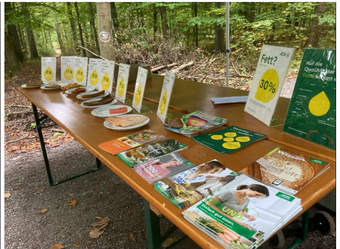
Konstruktiver Austausch im Dornet zur Arbeitssicherheit in der Waldarbeit (Bild 1, Jörn Hartmann), die auch durch bewusste und gesunde Ernährung verbessert werden kann (Bild 2, Jörn Hartmann)